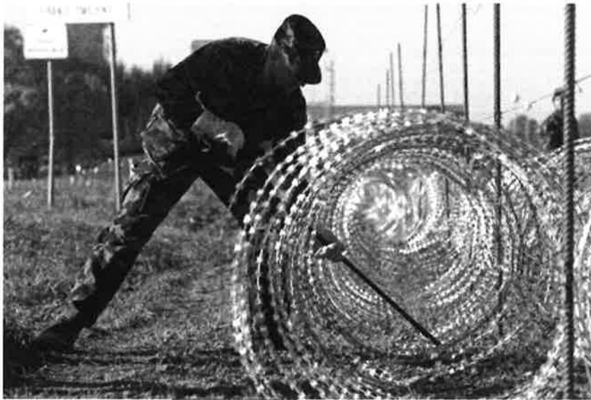
Bodeča žica na meji

Brez javnega razpisa, pač pa na povabilo, je notranje ministrstvo z mikro podjetjem Minis Bojana Plohla sklenilo skoraj pol milijona evrov težko pogodbo, za - kot so zapisali - pripravo terena in ograj ter samo postavljanje. Se pravi za storitev.