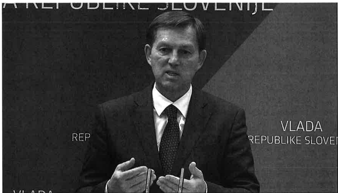
Posel za žičnato ograjo na meji je bil sklenjen v času Cerarjeve vlade.

Vpogled v poslovanje podjetja Minis je sicer hitro pokazal, da gre za podjetje brez resnejših referenc in s celo večkrat blokiranimi računi. Do posla z žico so ogradili le ljubljanski živalski vrt, celjsko bolnišnico in nekaj drugih javnih ustanov. V oči pade tudi podatek, da je sedež podjetja v Žalcu na istem naslovu kot je bila nekoč lokalna pisarna Cerarjeve SMC.