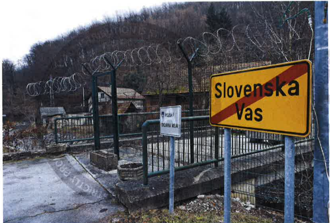
Ograja in rezilna žica se po odstranitvi manjšega dela raztezata še na skupno 177 kilometrih meje. Podjetje Minis, ki je ograjo tri leta postavljalo, naj bi jo zdaj štiri leta podiralo.

sebno orodje za montažo, sedaj pa pri odstranjevanju to ni več potrebno, je pa nujno, da se pri demontaži uporabljajo, če želite obdržati dele ograje